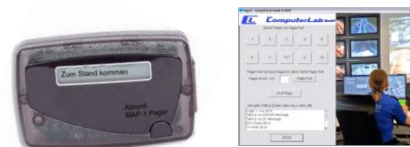
Arzt-Pager (UKW) SMS-Pager am PC

Arzt-Pager mit 1,5 km Reichweite per UKW über kostenlosen Kurzfunk oder per SMS direkt auf das Handy des Arztes, wenn dieser sich außerhalb der 1,5 km Reichweite aufhält.