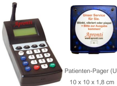
Patienten-Pager (UKW) 10 x 10 x 1,8 cm Sendestation (UKW)

Mit 1,5 km Reichweite per UKW-Funk rufen Sie kostenlos die Empfänger an. Benötigt wird nur eine Sendestation und eine ausreichende Anzahl Empfänger mit Ladegeräten.